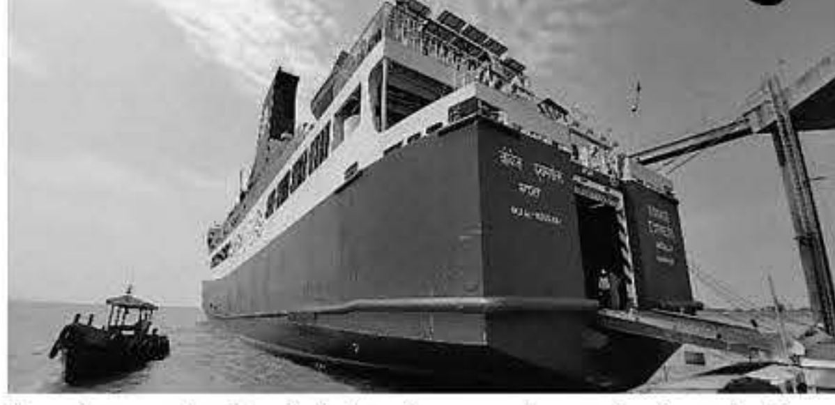
નોંધપાત્ર યોગદાન આપતાં આ સોલર ઉપયોગમાં પણ નોંધપાત્ર બચત કરશે. 9 વાગે અને હજુરાથી સાંજે 6.30 વાગે સુધી રો-પેક્સ ફેરી ઈંધણના વોજેજ એક્સપ્રેસ ઘોઘાથી સવારે કલાકે રવાના થશે, જ્યારે કે વોજેજ

નવગુજરાત સમય > આંધ્રગર સોનારને દરિયાઈ માર્ગે જોડતી રો-પેક્સ ફેરી સર્વિસ ટેકનો - ઈકોનોમિક ડ્રાઇવર થોડા સમય માટે બંધ થયા બાદ હવે આ સર્વિસ ફરીથી હજુરા ટર્મિનલ ખાતેથી શરૂ રહી છે. દરિયાઈ માર્ગે માત્ર 3.0 કલાકમાં હજુરા અને ઘોઘાને જોડતી આ સુવિધાને પ્રવાસીઓ અને માલસામાનના પરિવહન માટે વધુ અનુકૂળ બનાવતાં વોજેજ એક્સપ્રેસ ઈન્ડિયા દ્વારા ભારતની પ્રથમ સોલર દ્વારા સંચાલિત રો-પેક્સ ફેરીની સેવાઓનો ઉપયોગ થઈ રહ્યો છે. રિન્યુએબલ એનર્જીના ઉપયોગને પ્રોત્સાહન આપવાના સરકારના પ્રયાસોમાં